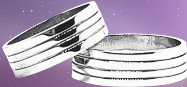
TRIPLE LÍNEA CENTRAL

EL DISEÑO DE ESTAS ARGOLLAS ES COMPLETAMENTE PLANO EN SU BASE Y AÑADE UN CALADO LINEAL CENTRAL PARA DAR EL TOQUE DE MODERNIDAD. PUEDE INCORPORARSE ADEMÁS ALGÚN FACETADO DE DISEÑO BASE.