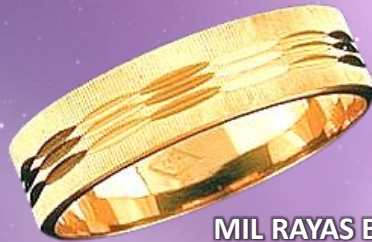
MIL RAYAS BISELADO