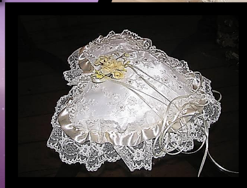
COJÍN ARGOLLAS (VARIADOS DISEÑOS)