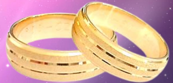
DOBLE LÍNEA CENTRAL BASE ARENADO