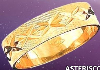
ASTERISCO MIL RAYAS