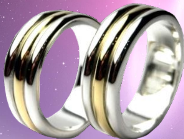
PLATA CON ORO