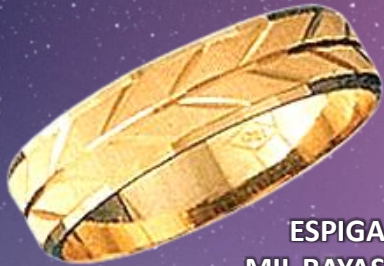
ESPIGA MIL RAYAS