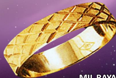
MIL RAYAS CUADRICULADO