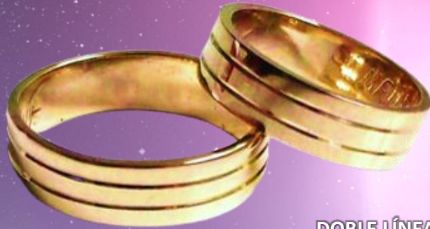
DOBLE LÍNEA CENTRAL